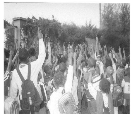
Thirst of the gospel at Bafoussam