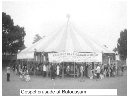
Gospel crusade at Bafoussam

Like John the Baptist, let us preach the truth and nothing but the truth, without any complaisance or compromise of principle. Like Daniel, let us make up our mind not to defile ourselves with the foods, wine and pleasures the world proposes to us.