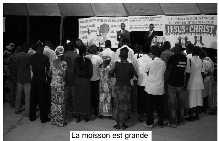
La moisson est grande

Pour les activités à venir... Priez sans cesse !