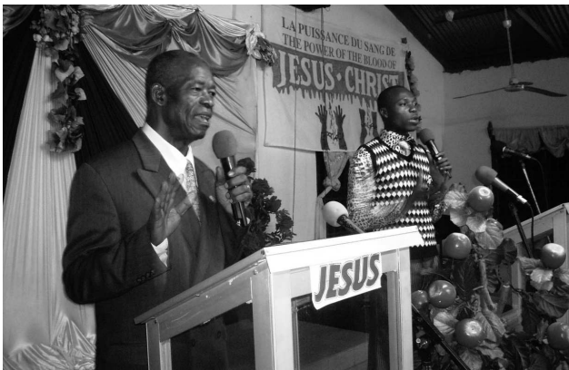
The Word of God being preached