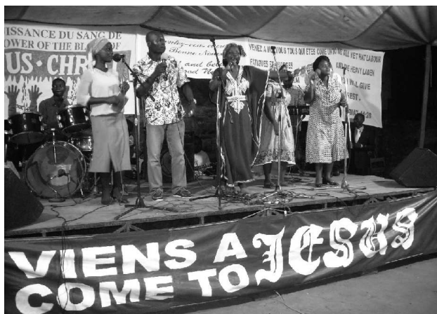
L'Equipe de Louange en Action