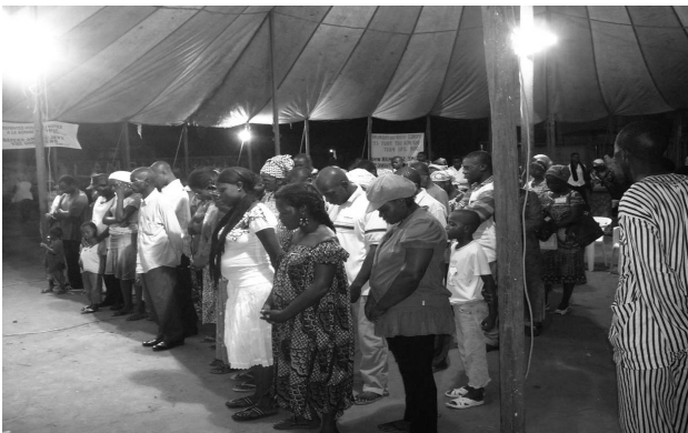
Souls responding the altar call

Now he that planteth and he that watereth are one and every man shall receive his own reward according to his own labour