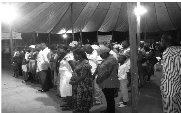
Les âmes répondent à l'appel

Celui qui plante et celui qui arrose sont égaux, et chacun recevra sa propre récompense selon son propre travail.