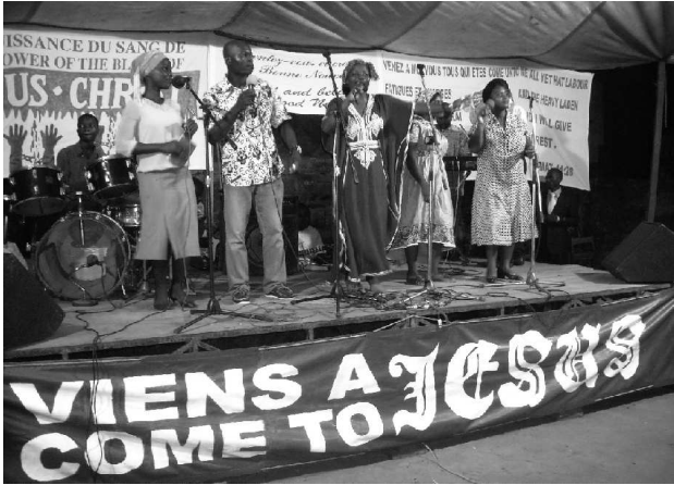
Praise band in action